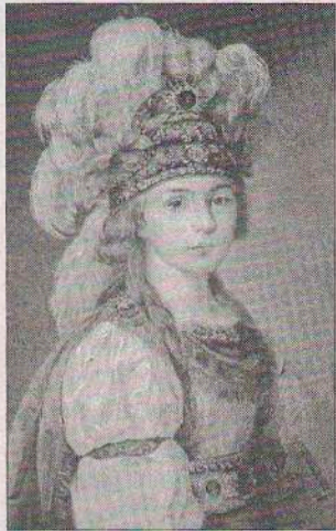
П.И. Жемчугова в роли Элионы.