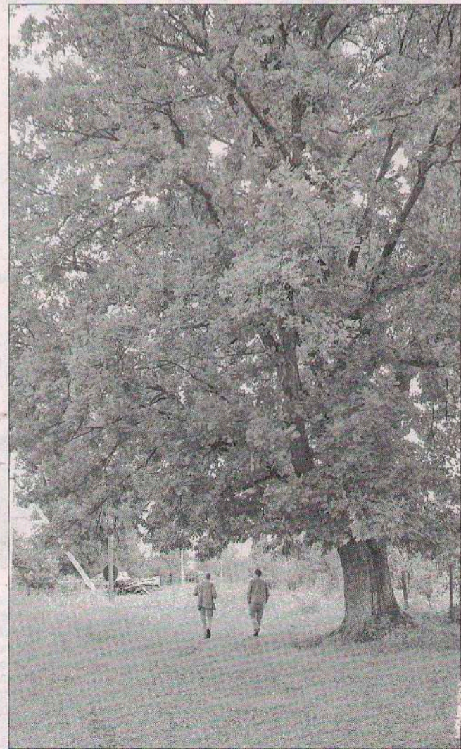
Старый дуб в деревне Березино.