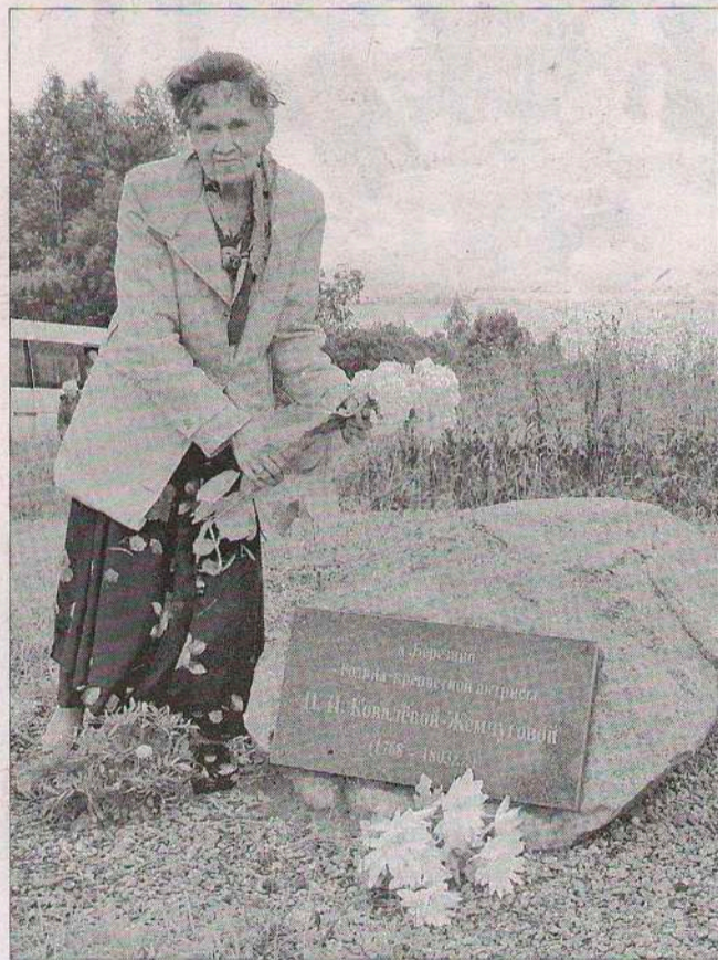
Памятный камень на родине П.И. Жемчуговой.