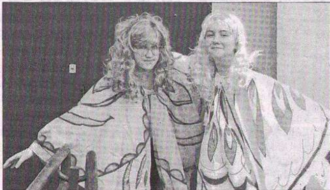
Библиотека-филиал № 14. Костюмерная.

20 и 21 апреля в библиотеках Ярославля прошла ежегодная всероссийская акция «Библионочь-2018» «Магия книги».