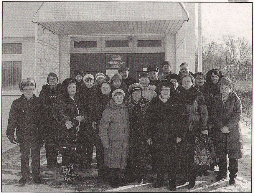
● Харовская центральная библиотека, которую посетили участники чтений, носит имя В.И. Белова