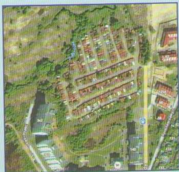
Улицы Пирогова и Звездная с микро-районом Липовая гора дошли до реки