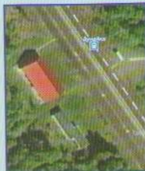
Построена ж/д станция под названием Дунайка