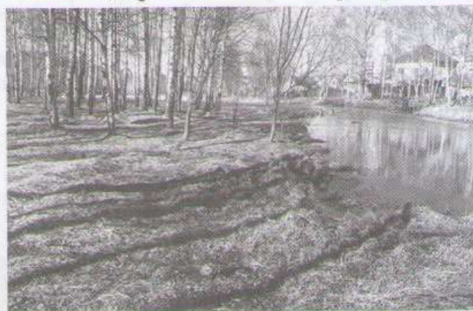
Рис. 5. Березовая роща вблизи пруда в парке