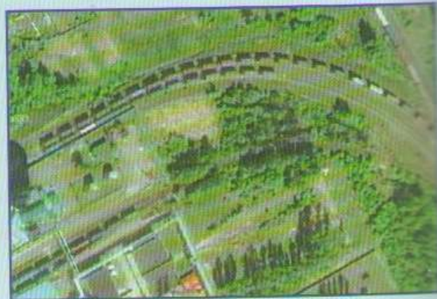
2 ж/д ветки построены по направлению к пивзаводу