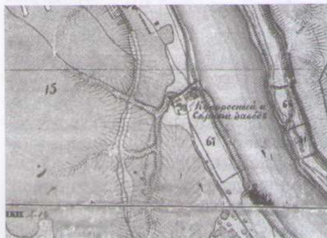
Рис. 1. Купоросный и серный завод на берегу р. Дунайки (карта Менде А.И., 1857 г.)

Согласно архивным документам, в 1737 г. ярославским купцом Свешниковым на ручье был построен серно-купоросный завод, при котором образовалось поселение. Так, на старинной карте 1857 г. А.И. Менде, найдя территорию современного Дядьково, можно прочесть – Купоросный и серный завод (рис. 1). В конце XIX – начале XX в. в устье реки были устроены грузовые причалы, а также нефтеналивные, лесо-