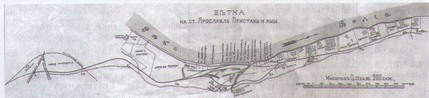
Рис. 2. Сельцо Дунайка вблизи Ветки на станцию Ярославль Пристань. План А.Я. Разроднова. 1911 г.

Следующей вехой в истории развития реки является строительство Ярославского судостроительного завода в 1920 г. Место для строительства завода было выбрано неслучайно и считается местом увековечения славы русского флота в названии реки. После этого, отмечается, что русло Дунайки меняется дважды: во-первых , после строительства стапельного цеха, и, во-вторых , при сооружении корпусо-заготовительного цеха, когда пришлось