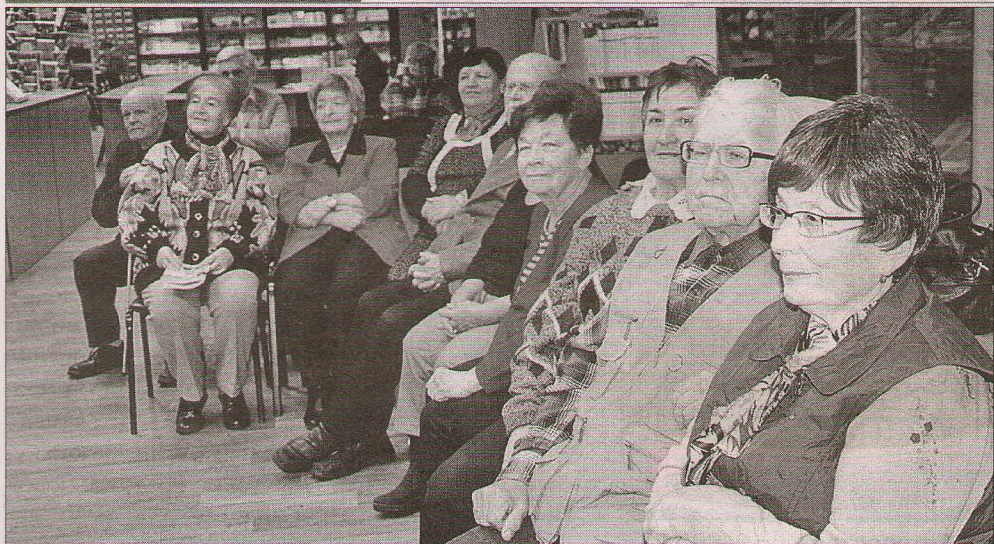
На праздновании юбилея клуба в Центральной библиотеке им. Лермонова.