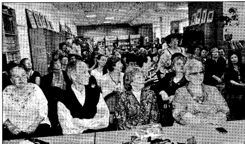
Праздник собрал много гостей