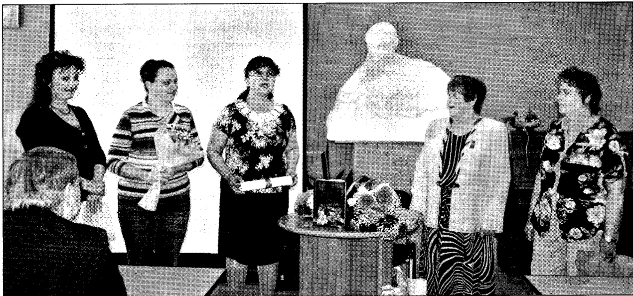
С тёплыми поздравлениями пришли в этот день коллеги