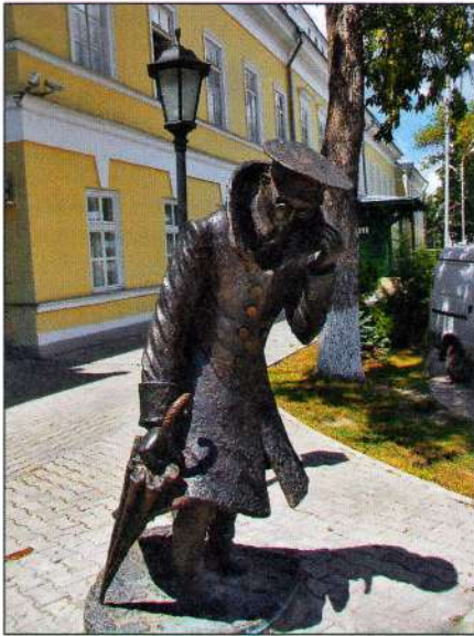
Учитель Беликов. Скульптор Д.Бегалов. Таганрог. 2010

подобными фактами порождает интерес школьников к писателю, возможно, делает какие-то его произведения частью их собственного жизненного опыта. Но не менее важным в учебном процессе при изучении творчества автора является использование уже давно знакомых практик, например таких, как взаимосвязь с библиотеками.