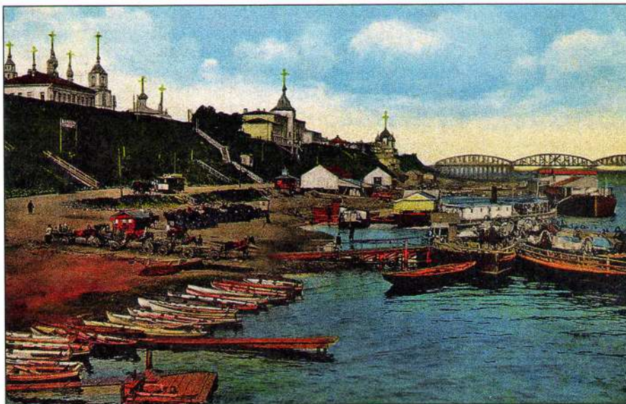
Ярославль. Набережная Волги

Последний визит Чехова в Ярославль состоялся в июле 1896 года. Он был связан с желанием посетить вместе с братом Михаилом Нижегородскую ярмарку. По плану братьев старший должен был доехать до станции Максатиха (между городами Бологое и Бежецк в направлении к Рыбинску), чтобы навестить А.С. Суворина, затем поездом доехать до Рыбинска, где пересест на пароход до Ярославля. Там к Антону Павловичу должен был присоединиться Михаил Павлович и дальше вместе с ним последовать в Нижний Новгород. Но плану не суждено было осуществиться, так как у Михаила Павловича возникли денежные затруднения. Совместная поездка не состоялась. Но старший Чехов