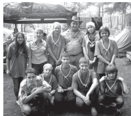
График приехавших на слёт всегда был расписан по минутам — после утренней линейки каждый был занят делом до самого вечера, когда начинались костры и песни под гитару или большие развлечения

тельные мероприятия на сцене, концерты. Подвижные игры и тренинги чередовались с интеллектуальными конкурсами — чтобы участники смогли показать свою разноплановость, развитие не только физическое, но и умственное.