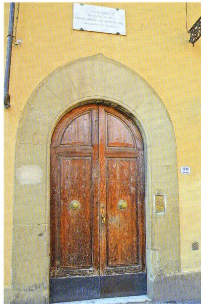
Дом напротив Дворца Питти. Именно здесь знаменитый писатель Фёдор Михайлович Достоевский закончил свой роман «Идиот» – об этом и сообщает мемориальная доска над дверью здания.

The house opposite Palazzo Pitti. It is the very house where Fyodor Dostoyevsky completed his novel «The Idiot» according to the memorial plate above the door.