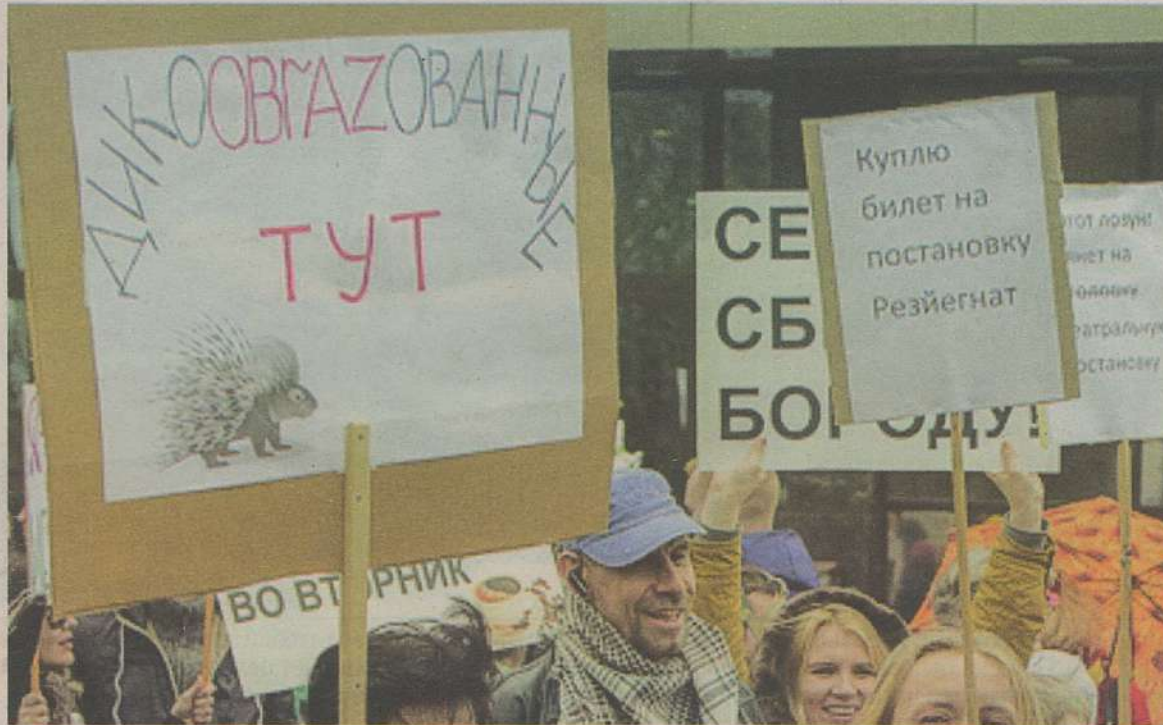
Так посмеялись ярославцы над нашей системой образования на последней демонстрации.

Родился 4 августа 1931 года в Ленинграде. Окончил 1-й Ленинградский педагогический институт иностранных языков и аспирантуру ЛГПИ им. Герцена. Преподает в Ярославском педагогическом университете (с 1962 г.). Доктор филологических наук, профессор. Ветеран труда. Почетный работник высшего профессионального образования.