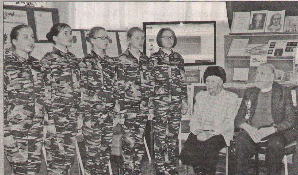
Военная песня в подарок.