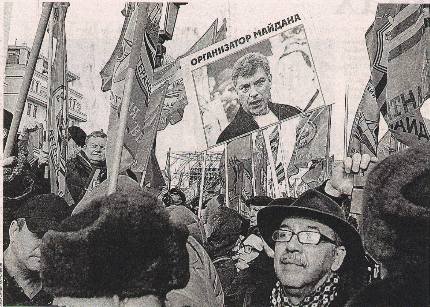
Борису Немцову не понравилось, что участники шествия «Антимайдан» несли вот такие плакаты. «Я против кровавых революций», — пишет Немцов в своем блоге и требует: «Верните выборы». Требуется как депутат Ярославской облдумы, победивший на выборах по списку РПР-Парнас. Требуется как бывший первый вице-премьер правительства РФ. В годы его нахождения в правительстве обнищавшие московские пенсионеры ходили с плакатами: «Остановили немцев под Москвой — остановим и Немцова сегодня!» Обидно? Конечно. Так зачем же все это возвращать.

Часть российской интеллигенции, та, которую видно и слышно