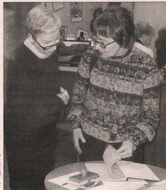
Гости юбилейного вечера.

В 1980 году библиотека им. Маяковского переехала на проспект Машиностроителей. Сегодня это одно из самых востребованных учреждений культуры Заволжского района — здесь более 13 тысяч читателей, книжный фонд составляет 130 тысяч