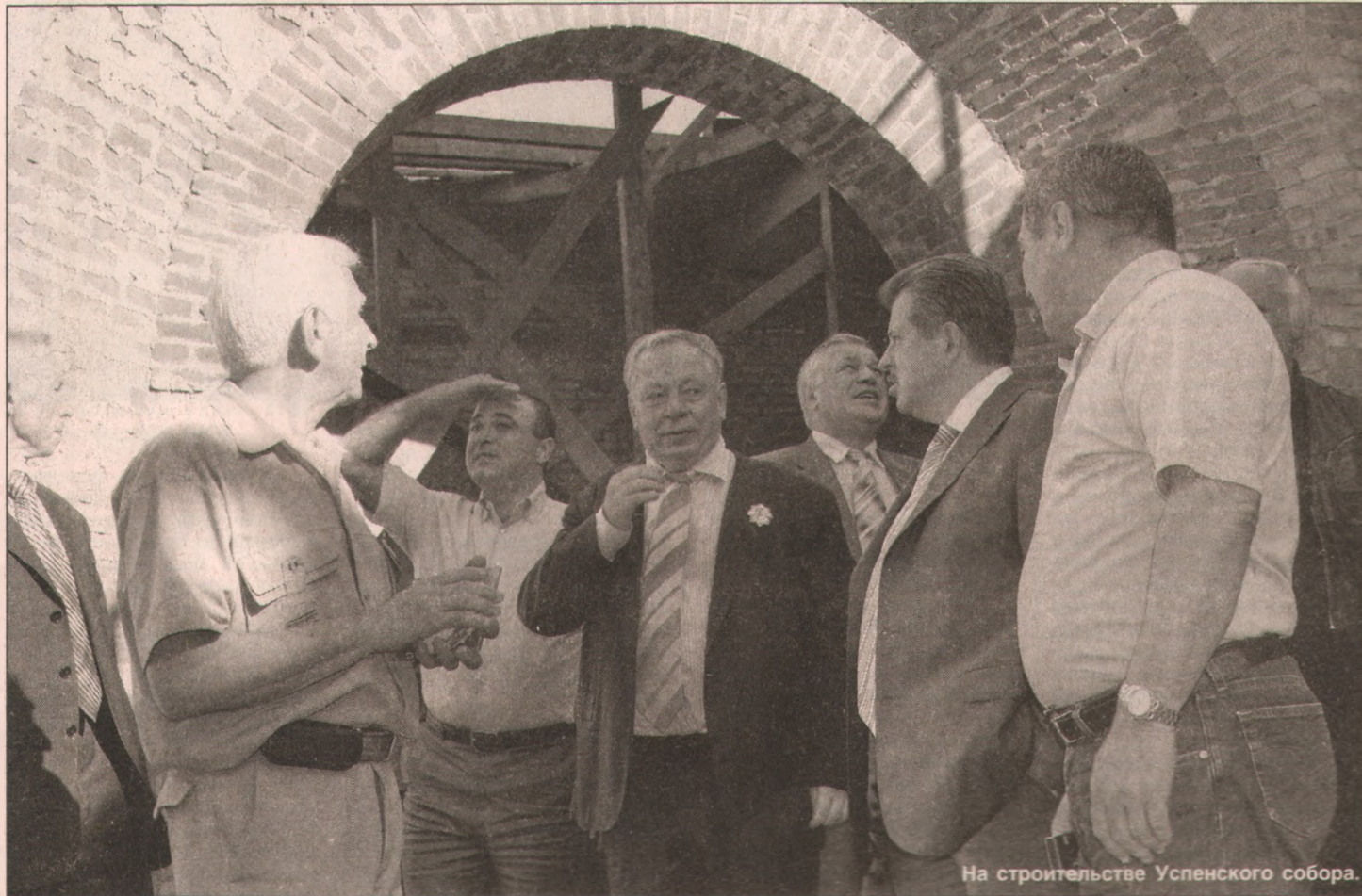
На строительстве Успенского собора.