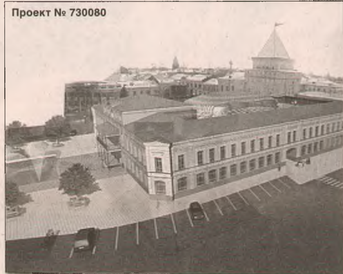
Проект № 730080

– Почему я участвую в этом обсуждении? Потому что площадь Волкова – это моя молодость. Мы даже выпускной вечер ездили отмечать сюда, в ресторан «Москва». С 1962 года мы приезжали на мотоциклах, конечный пункт был – площадь Волкова. Когда снесли здание у Знаменской башни, мы буквально потерялись, как будто в другой город попали. Хотя исторически оно ничего вроде из себя не представляло. Не надо тут возводить «хрустальную вазу». Нужно, чтобы новое вписалось в старину и современность тоже была видна. Мне понравились три проекта – номера 581627, 777777 и 007081. А если выбирать из них один, я за последний.