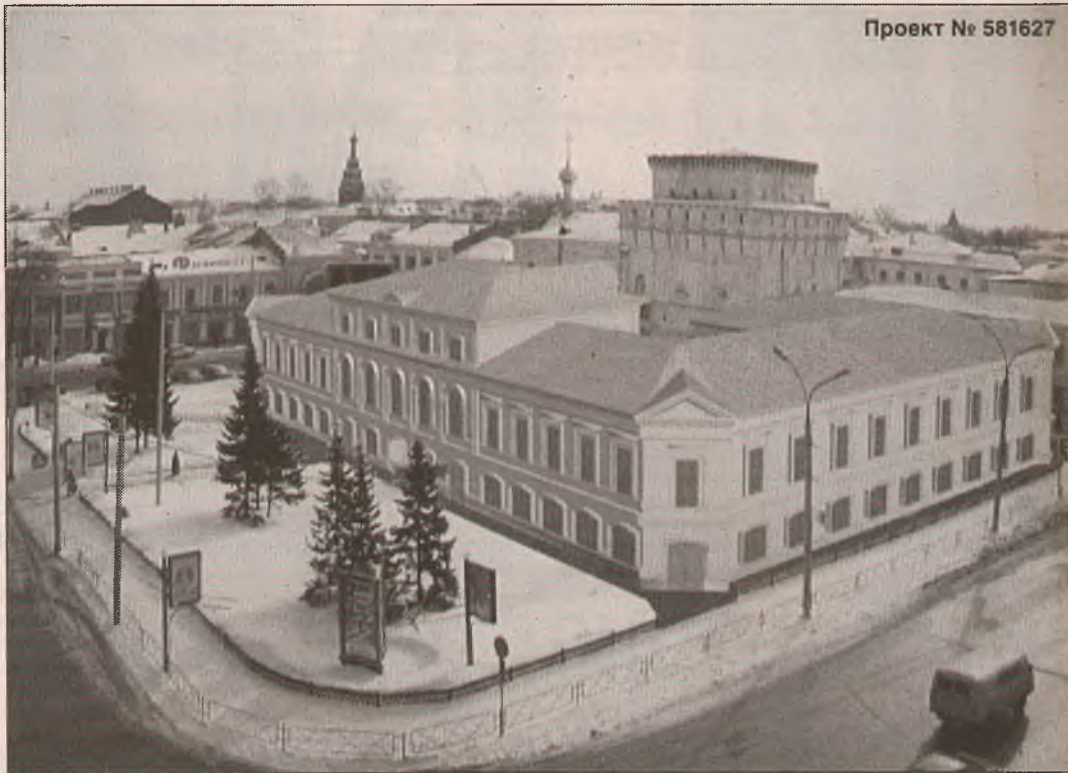
Проект № 581627

– Нужно сохранить историческую среду и «собрать» площадь. С градостроительной точки зрения она «рассыпалась» еще тогда, когда был снесен ансамбль Власьевского храма и на его месте, на углу улицы Свободы, было построено здание, которое совершенно не по праву царит сейчас над всей площадью. Я отдаю предпочтение проекту с восстановлением гостиницы (номер 581627) и предлагаю поработать над силуэтом этого «сундука» на углу. Может быть, это поможет, хотя до конца исправить ситуацию вряд ли удастся.