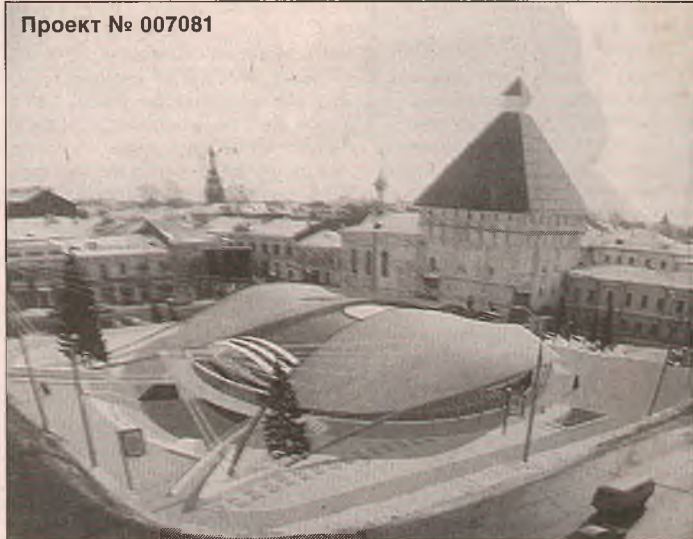
Проект № 007081

– Во-первых, здесь нужен подземный переход, меня об этом просили сказать presta-