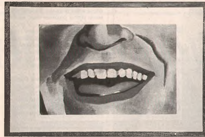
Наверное, под таким произведением уместно бы выглядела реклама стоматолога.