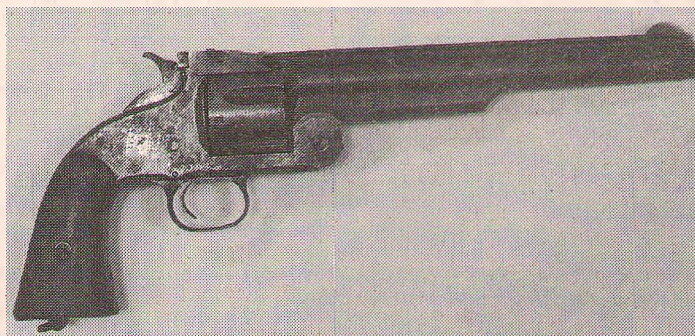
Кольт, которым пользовались ковбои Дикого Запада.

название оружию давалось по различным причинам. В коллекции УВД хранится немецкий револьвер «Арминиус», названный в честь вождя древних германцев Арминия. История у этого экземпляра трагическая. При задержании его криминальный владделец в 1999 году убил сотрудника милиции, ранил женщи-